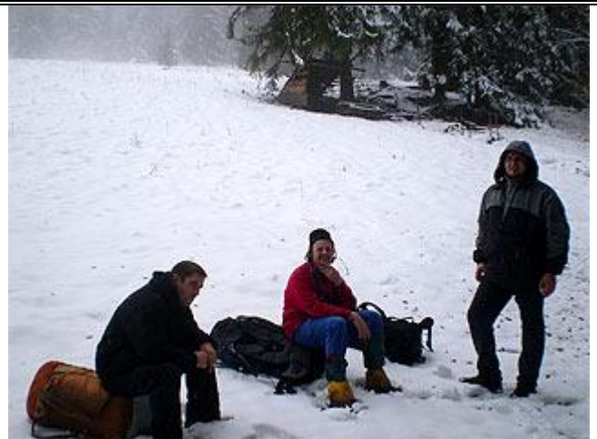
Привал перед пол. Буковина.