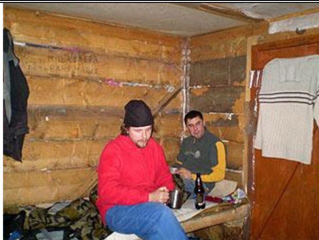
Внутри колыбы, условия пребывания хорошие.