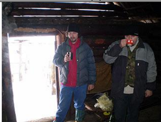
Продолжительный привал в колыбе на пол. Буковина, сделали на примусе чай.