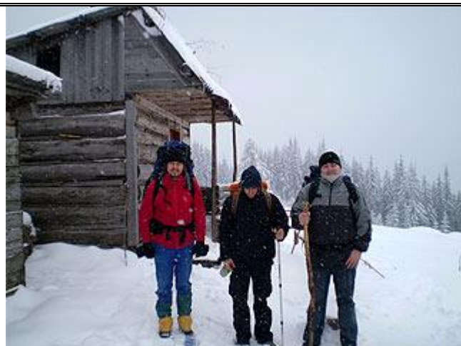
Идём домой, после ночлега.