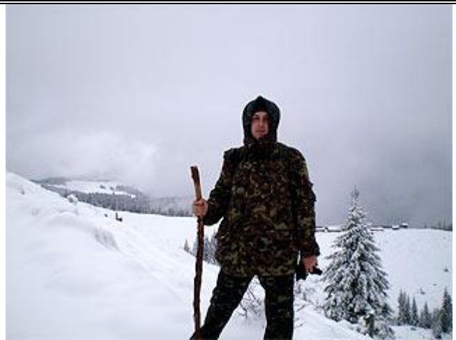
г. Григоривка (Пид-Бердя), у колыб на полонине Плэчанивка.