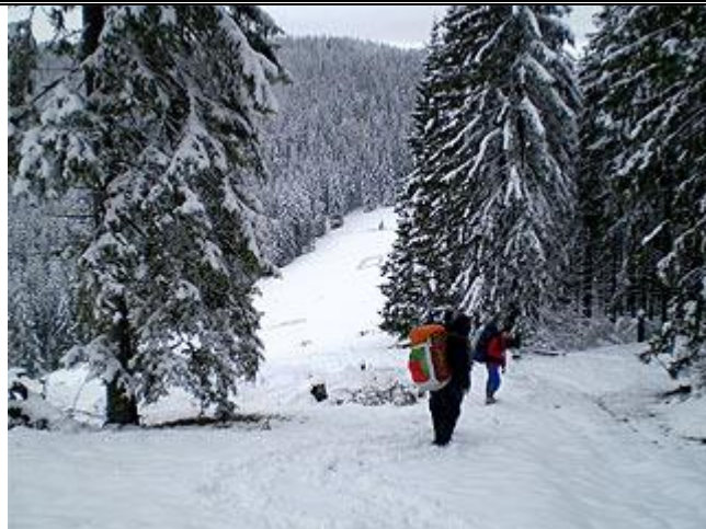
Вышли на полонину Буковина.