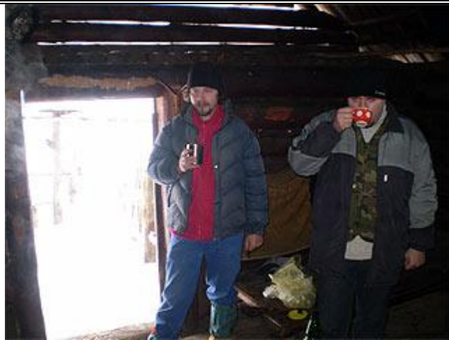
Продолжительный привал в колыбе на пол. Буковина, сделали на примусе чай.