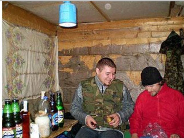
Наш бивуак: внутри колыбы на полонине Плэчанивка, готовим ужин.