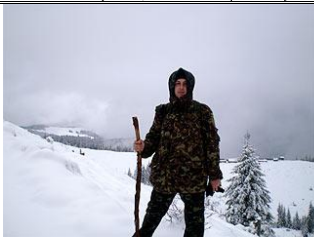
г. Григоривка (Пид-Бердя), у колыб на полонине Плэчанивка.