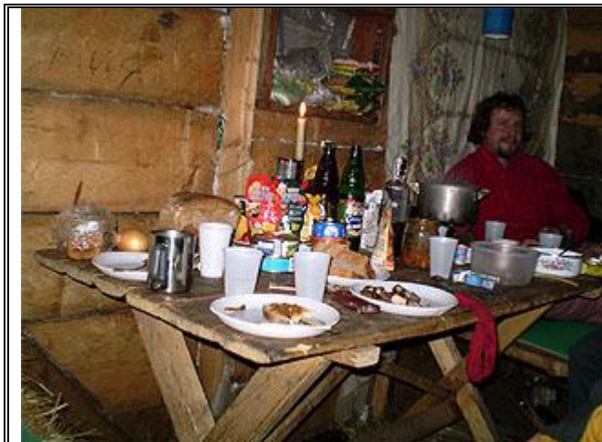
Внутри колыбы, наши припасы.