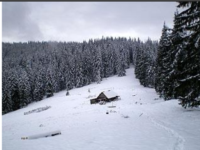
Колыба на пол. Буковина, летний домик горного пастуха.