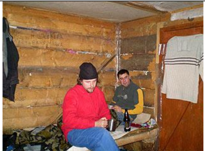
Внутри колыбы, условия пребывания хорошие.