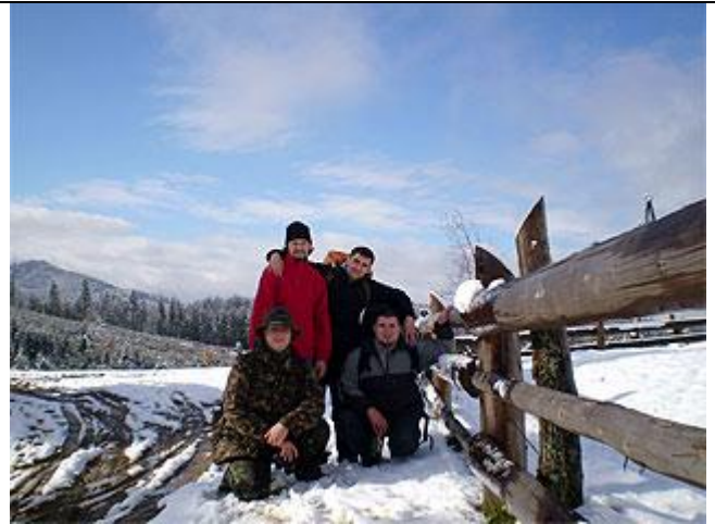
Село "Вороненко", вся наша туристическая группа.