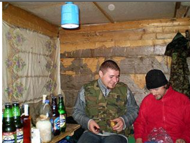
Наш бивуак: внутри колыбы на полонине Плэчанивка, готовим ужин.